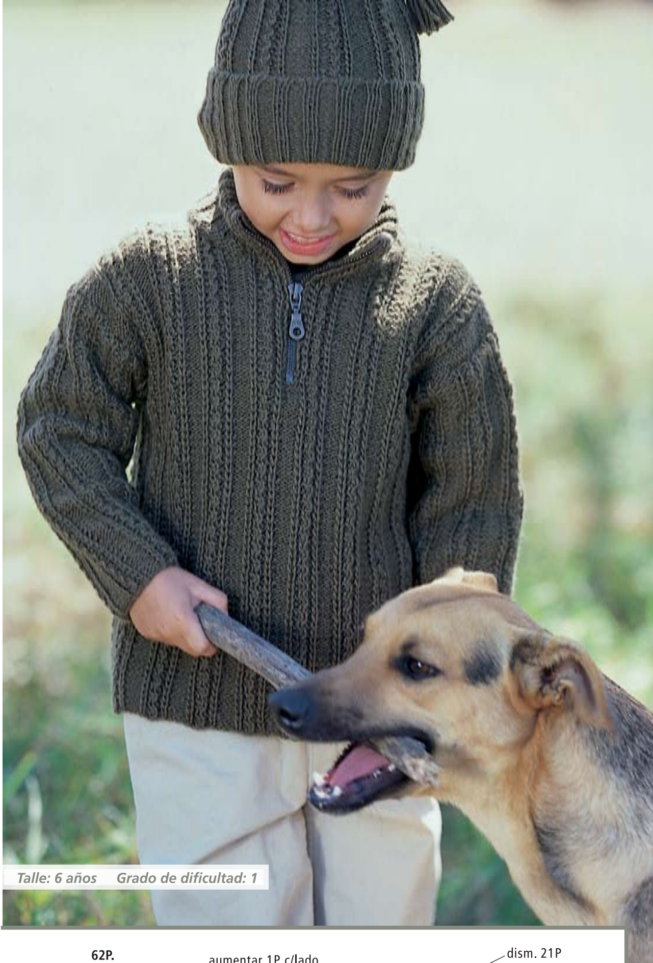
Talle: 6 años Grado de dificultad: 1